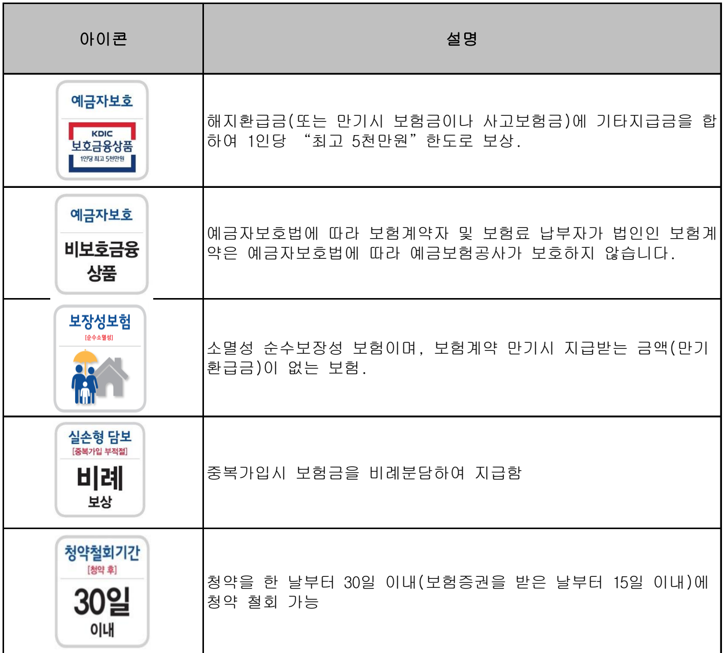
<별지> 「표1 : 보험상품의 특성정보 아이콘 설명」